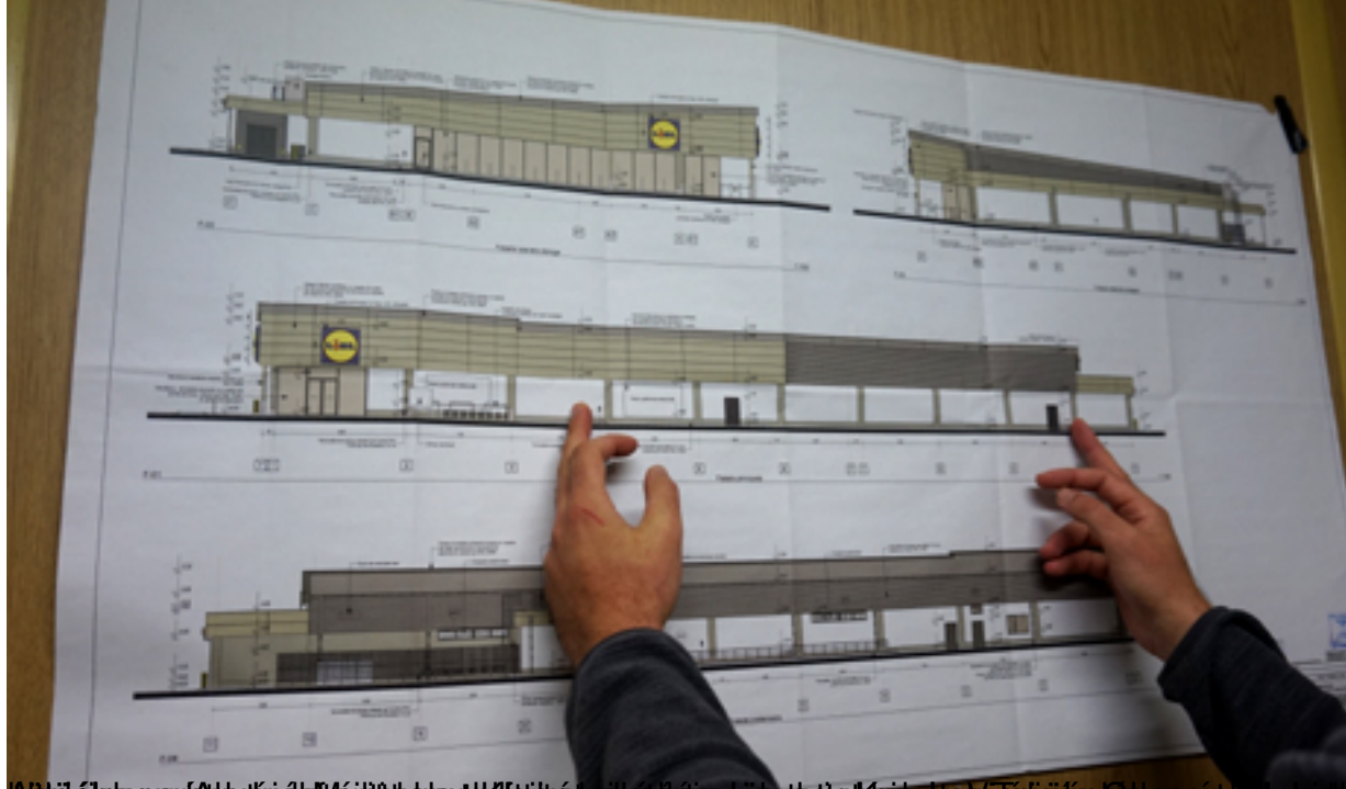
Az építési terv a régi Lidl tervét mutatja, de a régi Lidl tervét nem lehetett átvenni, mert az építési terv nem volt kész.