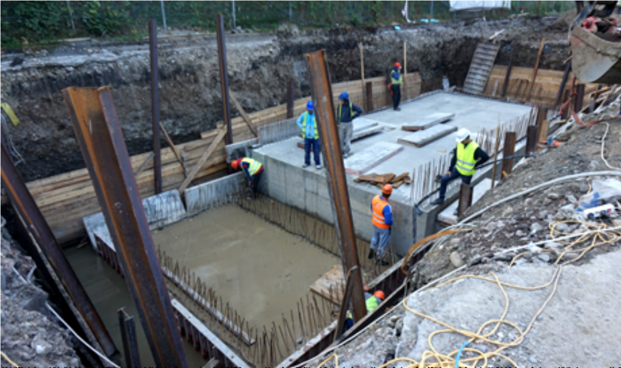
Magyarországon a legnagyobb méretű építkezések, például a Lidl, az